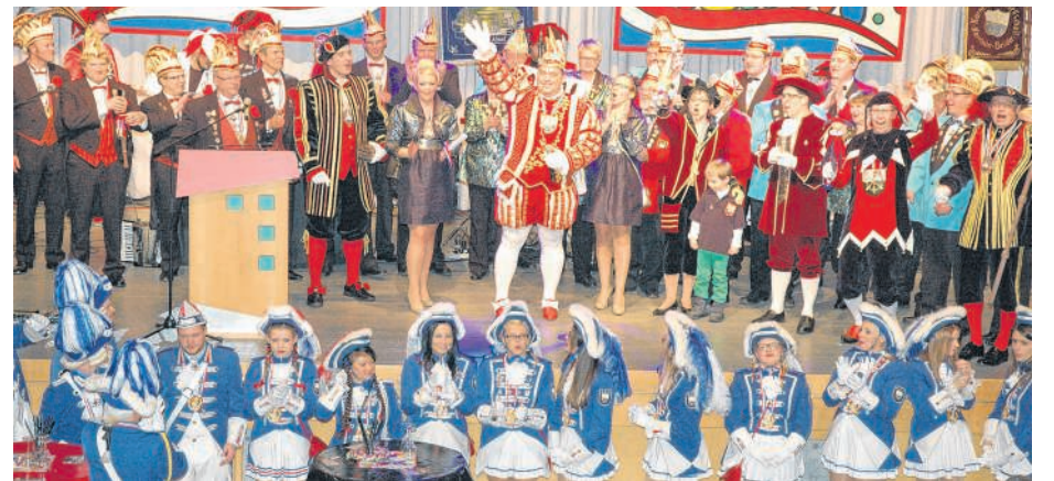
»Prinz Bomber I.« wurde mit seinem Gefolge den »närrischen Untertanen« im Bürgerhaus vorgestellt.

bi« im Gefolge von »Prinz Jürgen« und »Prinzessin Petra« Furore. Nach diesen »Lehrjahren« folgte als logische Konsequenz, dass nun er als »Jubiläumsprinz« in der Session 2013/2014 in Frage kam. »Vergesst alle für ein paar Stunden eure Sorgen und feiert mit uns bis in den frühen Morgen!«, rief »Bomber« seiner Narrenschar zu und erfreut sie mit den Prinzenliedern »Mir feire durch die Nacht« und »Awe os Häerz – jehört janz Kottem«. Galerie im Internet: www.wochenspiegellive.de www.kg-kottenheim.de